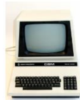
Commodore CBM 4032, 1977, 16,7 kg, FDMC 20