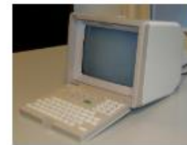
Alcatel Terminatel 258, ab 1980, 4,6kg, Minitel French Network Computer, FDMC 31