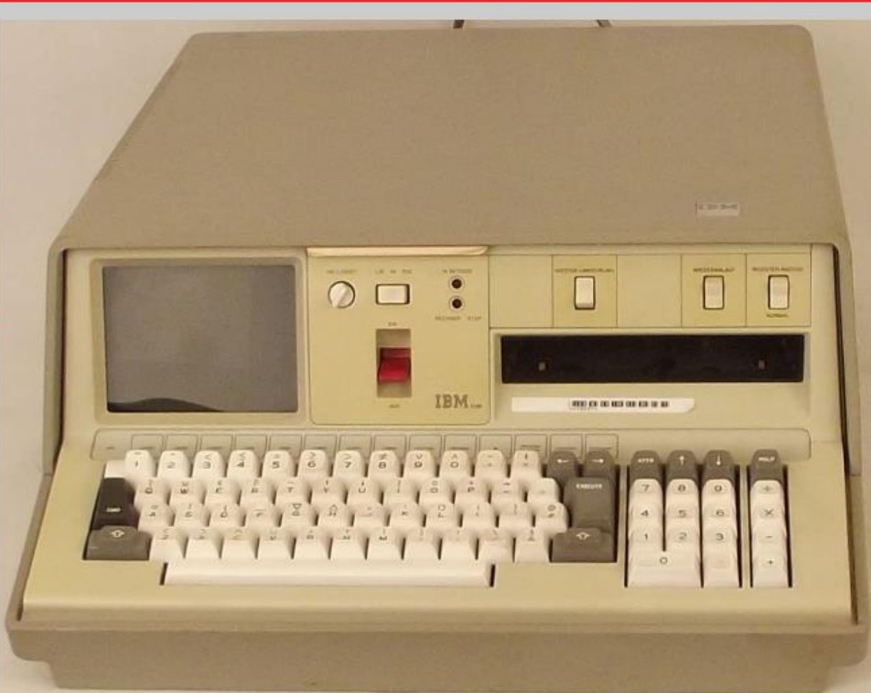
IBM 5100, 1975, 21,8kg, erster Mikrocomputer von IBM, Sammlung Arithmeum, FDMC 1517.

Das Schaudapot kann nur im Rahmen einer Führung und nach Voranmeldung besucht werden.