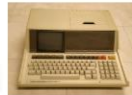
HP 83A, 1979, 7 kg, Small Desktop Personal Computer, FDMC 3, © Arithmeum