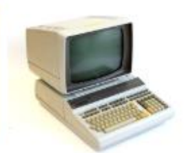
HP 9835A, 1978, 23,9 kg, Desktop Computer, FDMC 6, © Arithmeum