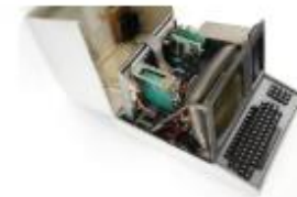
Heathkit H89, 1979, 20,9 kg, Personal Computer, © Arithmeum