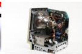
Apple Macintosh Plus 1, 1986, 7,4 kg, FDMC 33, © Arithmeum