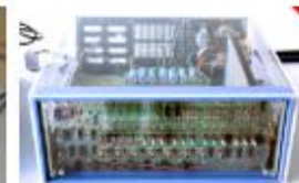
Altair 8800 MITS, 1974, binär programmierbarer Computer, FDMC 153, © Arithmeum