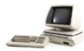
Commodore CBM 710, ab 1980, 13,7 kg, FDMC 97, © Arithmeum